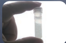
ネジロマイクロチューブ 1.5/2.0ml×1本